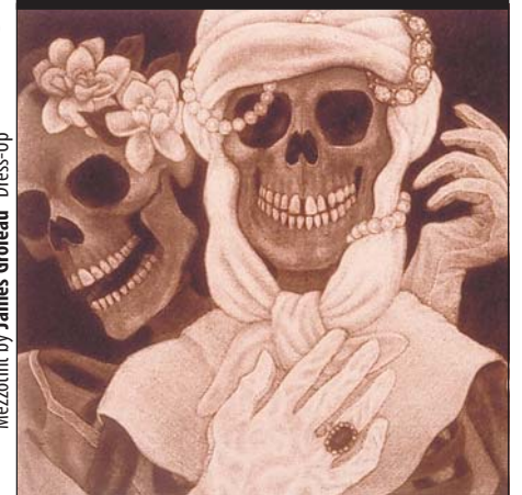
Mezzotint by James Groleau "Dress-Up"

Support La Voz! Become a Sponsor, Subscribe, Advertise – Help us to succeed!