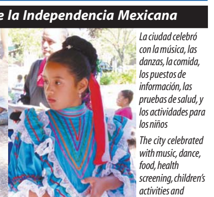
THE CITY OF SANTA ROSA CELEBRATED MEXICAN INDEPENDENCE DAY • Photo: ANI W. MORSE • see page 18