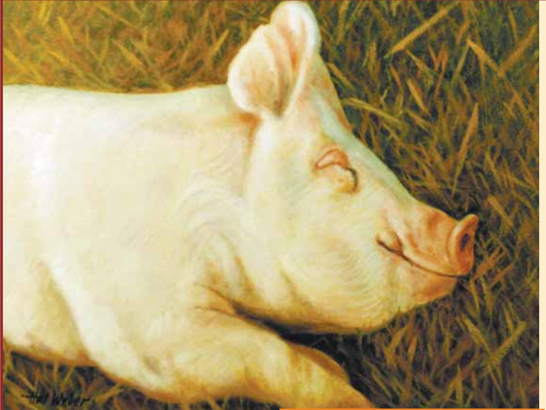
Painting by Hal Weber • hwpaintbrush.com

¿Qué como? Bueno, como unas raíces que llaman champiñones Caracoles, huevos, algún roedor o frutas, aunque no en montones En tierras silvestres muchos tubérculos, o una rata, yo comeré Pero en la granja comiendo todas las sobras muchísimo engordaré