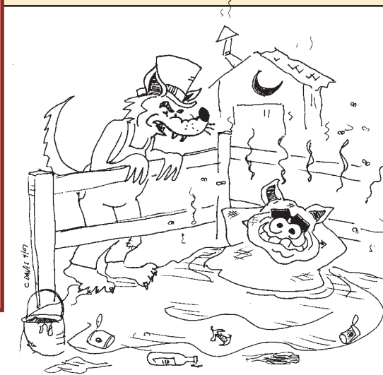
Y YO SOY EL CUARTO CERDITO. SR. LOBO MALO. SI USTED QUIERE LLAMAR A ESTE DESORDEN COMOS "CASA" ¡PUEDE SOPLAR Y SOPLAR TODO LO QUE QUIERA, MI AMIGO!