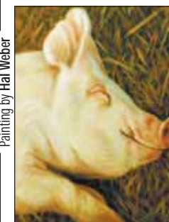
Painting by Hal Weber

El Cerdito Sensible, en la sección de Niños de La Voz, un poema que trata sobre un cochinito, por Radha Weaver, y una pintura de Hal Weber, Entretendida y educativa a la vez. Vea la página 9.