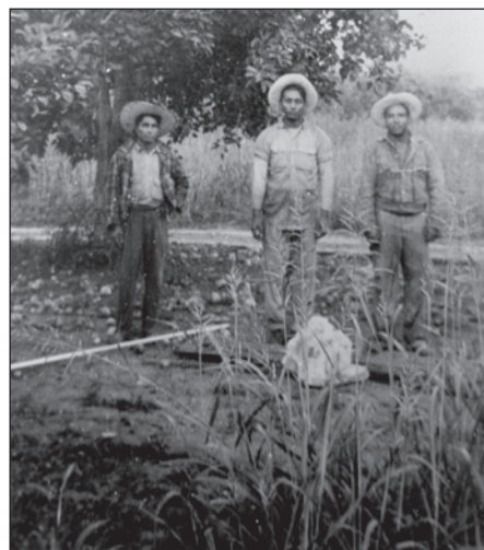
Braceros in Healdsburg, California

El presidente Kennedy se sintió presionado al final del Programa Bracero cuando escuchó reportes sobre las condiciones inhumanas creadas y los reclamos de los estadounidenses sobre el robo de empleos. Aun así, los agricultores estadounidenses lucharon en contra del Congreso para mantener el programa bracero abierto. Reclamaban que nadie realizaría estos trabajos con los salarios que permitían que la producción agrícola generara ganancias. Los agricultores perdieron la lucha y el Programa Bracero llegó a su fin en diciembre de 1964. El fin del programa generó un mayor incremento en la mecanización para la producción agrícola y la creación de sindicatos de trabajadores del campo.